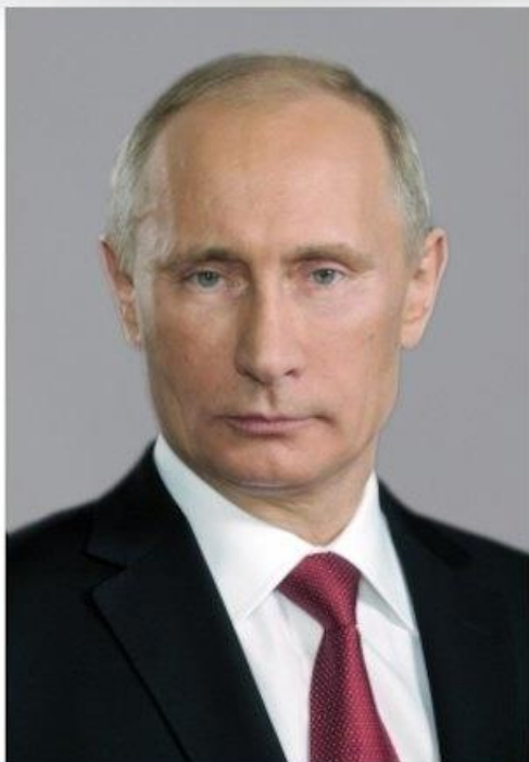
Владимир Путин, Президент РФ: «Коррупция деморализует общество, разлагает власть и госаппарат».

Сегодня коррупция существует в любом государстве. Но для одной страны это является проблемой, мешающей развитию, а для другой позорное явление, которое существует вне рамок правового поля. Россия ведет борьбу с данным явлением уже не одно десятилетие, но актуальность данной темы все еще велика. Коррупция является следствием общих политических, социальных и экономических проблем государства.